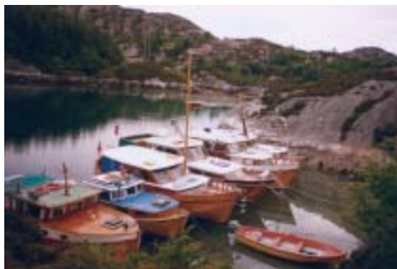
Trebåtvener ved Soløy.