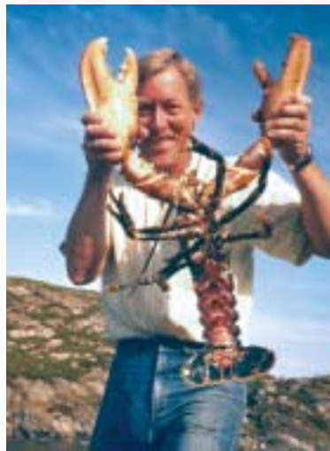
Rekordkardinal? - Lengde 49 cm, 4,5 kg.

PS! Redaksjonen takker besten for mange gode og innholdsrike innlegg i bladene, og vil gjerne gi han en vimpel (eller en boks kattemat).