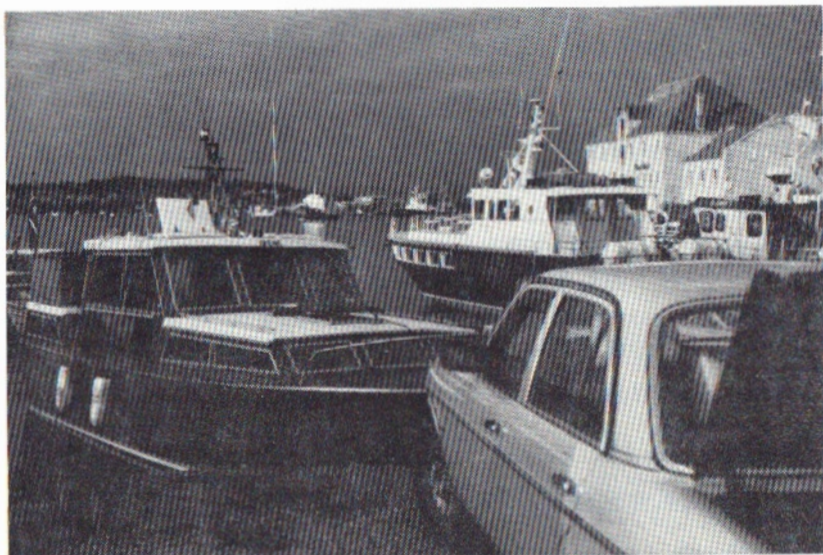
Havnen på Leirvik.