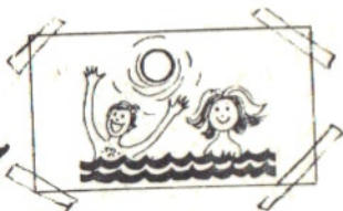
FOTO · KONKURRANSE